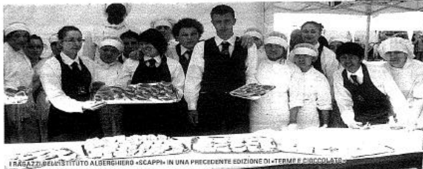
I RAGAZZI DELL'ISTITUTO ALSBERGHIERO «SCAPPI» IN UNA PRECEDENTE EDIZIONE DI «TERME E CIOCCOLATO»